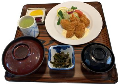
カキフライ定食 1,380円