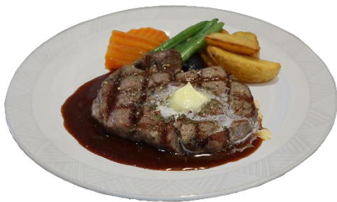
120g 龍馬ステーキランチ 1,930円