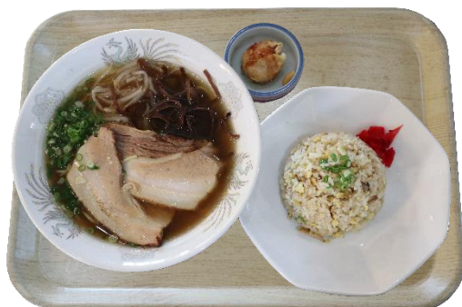
チャーシューメンセット