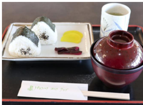
おにぎりセット 590円