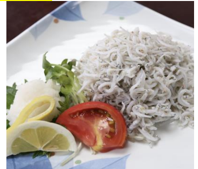
釜揚げちりめん 810円

*クジラのタタキ 1,380円 *メヒカリの唐揚 1,210円 *ウツボの唐揚 860円 *キビナゴの唐揚 590円