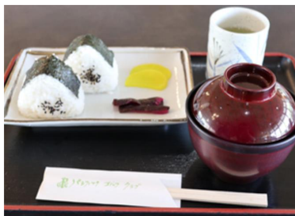
おにぎりセット 590円