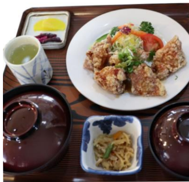
若鶏からあげ定食 1,380円