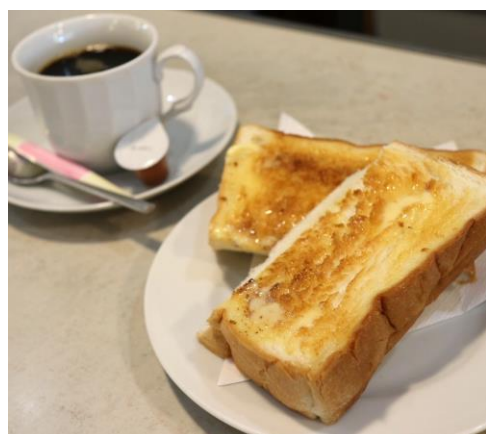
トーストセット 590円