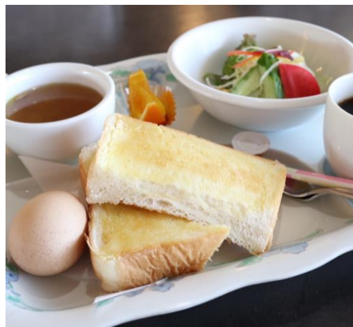
モーニングセット 690円