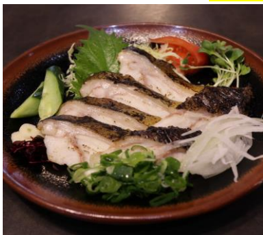
ウツボのタタキ 1,380円