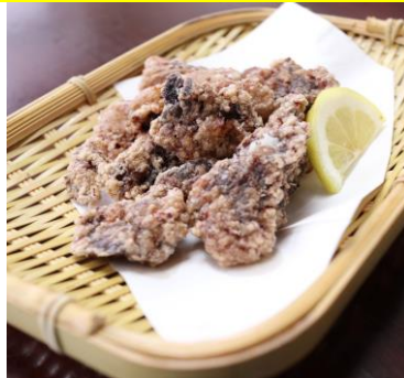
クジラの竜田揚 860円