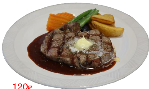
120g 龍馬ステーキランチ 1,930円